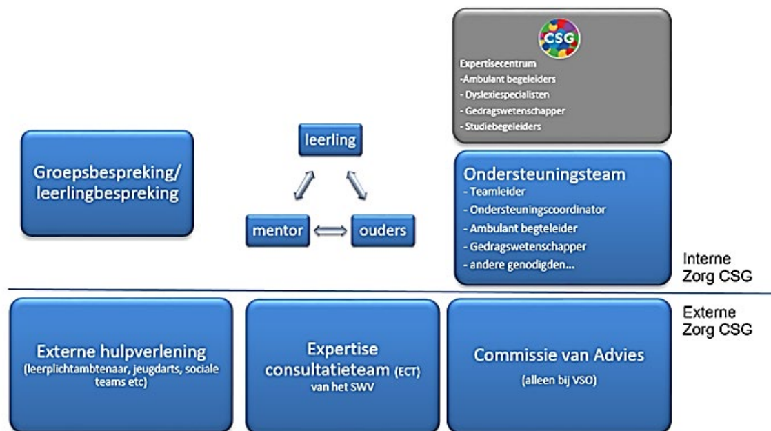
Figuur 5: Zorgstructuur CSG-vestigingen in samenwerking met externe partners

Wanneer de ondersteuningsvraag van een leerling het aanbod van de CSG overstijgt, wordt de leerling verwezen naar een school voor voortgezet speciaal onderwijs (VSO). Deze heeft een toelaatbaarheidsverklaring (TLV) nodig die is afgegeven door het samenwerkingsverband. De Commissie van Advies (CVA) van het samenwerkingsverband adviseert het bestuur van het samenwerkingsverband over het afgeven van een TLV voor het speciaal onderwijs. Zij toetst de aanvragen voor een TLV inhoudelijk en procedureel en bepaalt wie er als tweede deskundige optreedt.