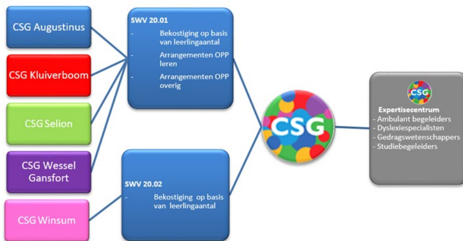
Figuur 3: Financiering basisondersteuning en aanvullende ondersteuning binnen de CSG

Voor de vestigingen die vallen onder samenwerkingsverband 20.01 moeten de arrangementen (OPP leren en OPP overig) worden aangevraagd bij het samenwerkingsverband op basis van het aantal leerlingen dat een ondersteuningsbehoefte heeft, om van daaruit ondersteuning en de bijbehorende experts te kunnen financieren. Het aanvragen van arrangementen is een verantwoordelijkheid van de vestigingen. Ieder jaar zullen de vestigingen de vraag naar arrangementen en experts voor hun vestiging inzichtelijk moeten maken en hiervoor zullen zij arrangementen aanvragen bij het samenwerkingsverband 20.01. Vervolgens wordt door de vestigingen de financiering eerst afgedragen aan het Expertisecentrum en het resterende bedrag overgemaakt aan de vestigingen (zie figuur 3).