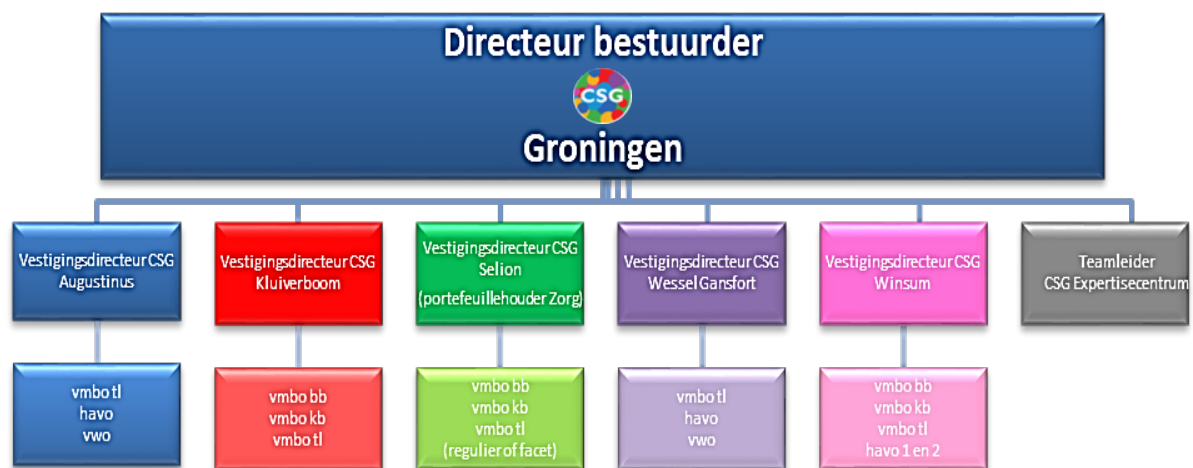
Figuur 1: organisatie en onderwijsaanbod CSG

Onderwijs en opvoeding liggen in elkaars verlengde. De CSG is samen met de ouders verantwoordelijk voor een maximale ontwikkeling van de leerlingen: De school als verlengstuk van thuis voor wat betreft de opvoeding en omgekeerd als het gaat om kennisoverdracht. Het uitgangspunt is de driehoek ouder, kind en school. Deze driehoek is de basis voor een goede ontwikkeling van de leerling als mens. Door met elkaar in gesprek te zijn over de ontwikkeling van de leerling, en daar de ruimte en tijd voor te nemen, wordt er gezamenlijk gewerkt aan dezelfde doelstellingen. Als er extra ondersteuning nodig is, wordt er gezamenlijk gewerkt aan de doelstelling: één kind, één plan. De CSG heeft 5 vestigingen (zie figuur 1).